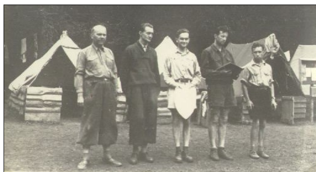
Fotoj el la SET-kroniko